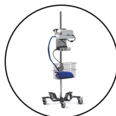
Stojalo za infuzijo, s košarico