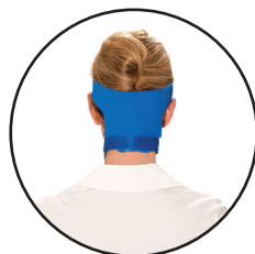
OKCIPITALEN (glava zadaj)