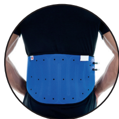
HRBET, TREBUH, KOLK