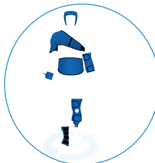
Bogata ponudba obkladkov za celo telo