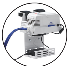
Nosilec za bolniško posteljo